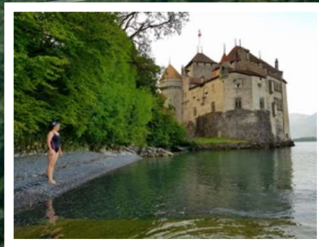
Château de Chillon

Distance: 70km Temps moyen de nage: 32 heures Solos à ce jour: 6