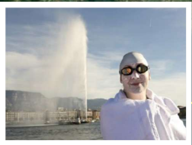
Bains des Pâquis